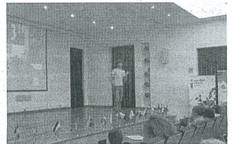
Diogo Batista (Erasmus Student Network)