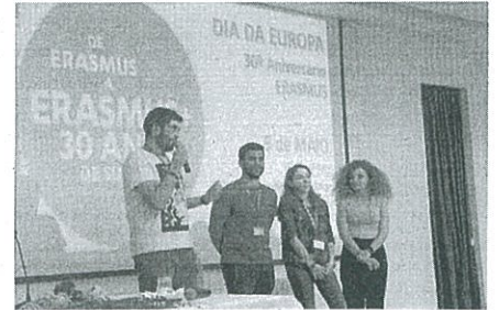
Testemunhos Estágios e Serviço Voluntário Europeu