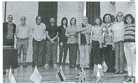
Vários convidados assistiram à exibição de "África Abençoada"

A iniciativa, que decorreu nas instalações da EPA, teve como objectivo "sensibilizar os alunos para a realidade actual de África" ou "desenvolver a capacidade de integrar conhecimen-