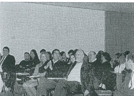
Debate com a presença do Deputado ao PE, Miguel Viegas