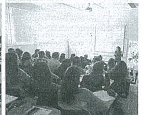
Estudantes da UA