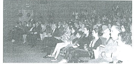
Iniciativa contou com casa cheia

Recentemente, realizou-se um convívio com a finalidade de angariar fundos para o restauro dos altares e imagens da Igreja Matriz da paróquia de Santa Maria em Sever. Pelo palco do CAE passaram vários talentos severenses. Nesta iniciativa, com a venda de bilhetes e alguns donativos, a comissão de angariação de fundos conseguiu angariar mais de 5 mil euros.