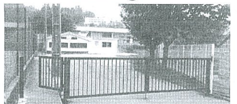
Colocação do portão era uma prioridade

Recentemente, o Grupo Recreativo Cultural e Social Silvaescureense, colocou um portão na entrada das instalações da associação. A colectividade valoriza a obra, uma vez que traz mais segurança. "É com enorme satisfação, dedicação e orgulho