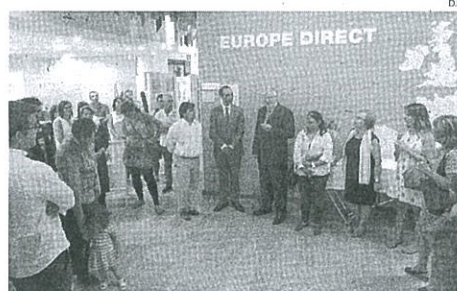
Embaixador da Eslováquia esteve em Aveiro