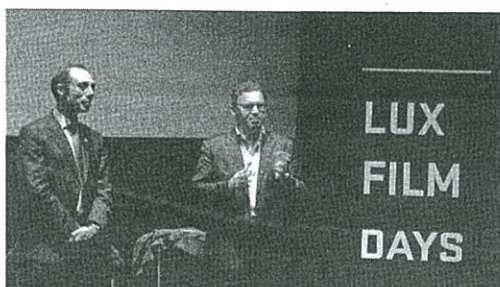
Presidente do CIEDA e Chefe do Gabinete do PE em Portugal