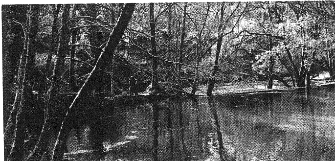
Projecto Rios pretende criar uma rede de "cuidadores dos rios"

ASPEA, dedicou o prémio a todos os grupos de voluntários que "têm contribuído para melhorar as condições ambientais dos nossos rios". O Projecto Rios está implementado em 107 municípios e o principal objectivo é o apadrinhamento de um troço de 500 metros de um rio ou ribeira por parte de um grupo de pessoas, facultando um conjunto de materiais (Kit Projecto Rios) para ajudar os grupos para as tarefas junto ao rio, na recolha de dados, intervenções de melhoramento. Pretende-se